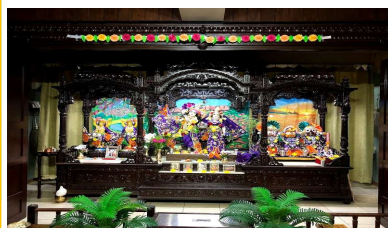
Iskcon Temple (東京江戸川区)