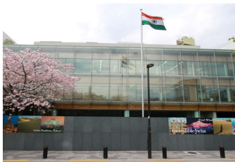
インド大使館 (東京)