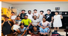
在日インド人の家族と一緒に