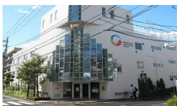
グローバル・インディアン・ インターナショナルスクール 訪問 (東京江戸川区)