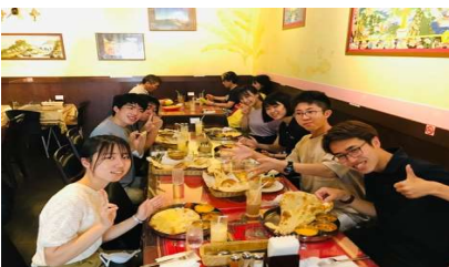
インドレストラン (吉祥寺)