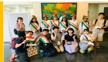
在日インド人の子供達と一緒に