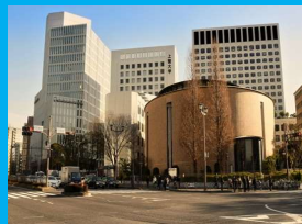
聖イグナテオ教会 (四谷)