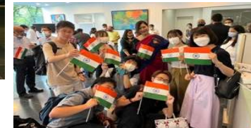
在日インド人の女性と一緒に

フィールドワーク説明会:2023年1月18日(水) 12:55～13:25 R49 教室および Zoom のハイフレックス (Zoom ミーティング ID : 842 1376 0313 パスコード : 478015)