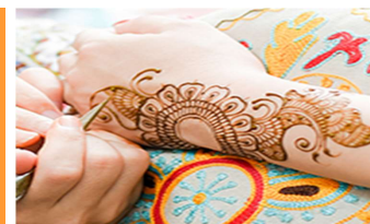
メヘンディ体験 刈谷市