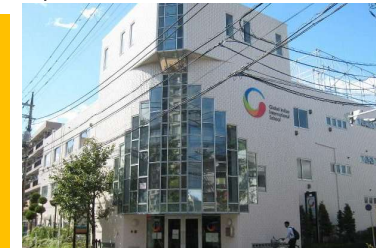
グローバル・インディアン・インターナショナルスクール訪問 (東京江戸川区)