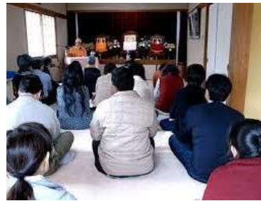
日本ヴェーダーンタ協会 (神奈川県逗子市)