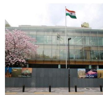
東京インド大使館 (8月15日インド独立記念日への参加)