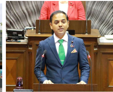
よぎさん、インド出身の議員のお話