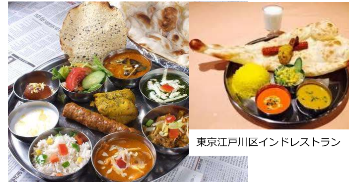
東京江戸川区インドレストラン