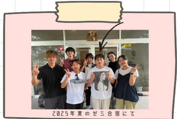
2025年夏のゼミ合宿にて

ゼミコンセプト 日常からひもとく！ 行政法ゼミ *先生の専門：行政法、地方自治法、都市法、環境法