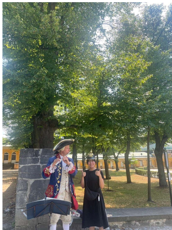
ポツダム サンスーシ宮殿