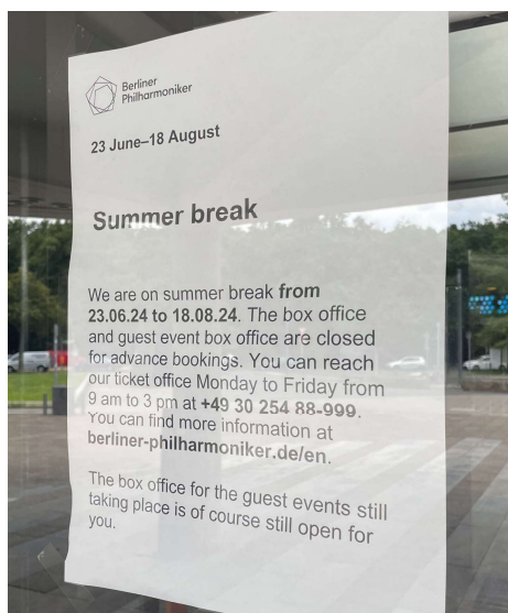
ベルリンフィルハーモニー