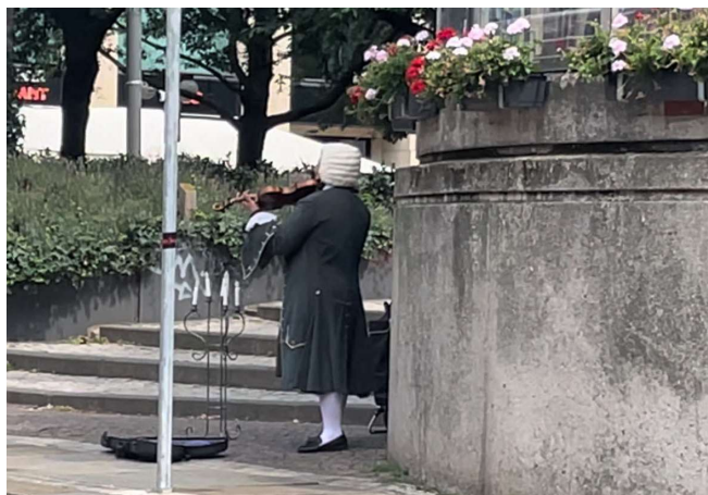
ライプツィヒ 聖トーマス教会付近