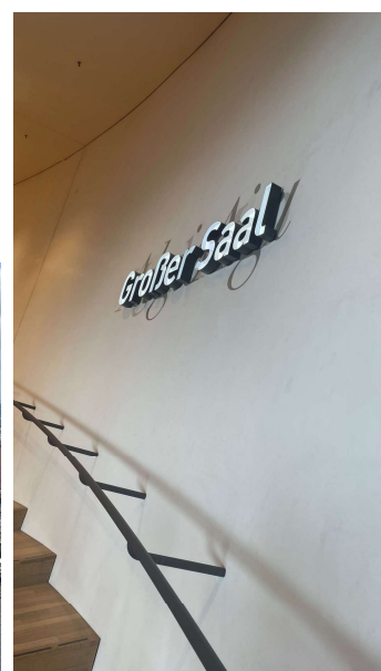
ハンブルク エルプフィルハーモニー