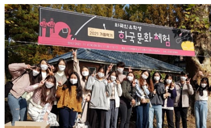
文化体験行事の様子