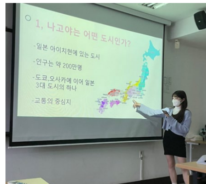
授業で名古屋についてプレゼンした時の様子

留学中にはコロナ禍ということもあって、予期せぬ出来事がたくさん起こりました。特に、現地に到着後、授業が全てオンラインになると告げられた時は、本当にショックでした。やっと留学へ行けるようになったのに、現地の大学に通うこともできず終わってしまうのかと思うと大変悔しかったのですが、せつかくの留学を少しでも有意義なものにするために、日本人留学生と現地の学生が交流できるようにするサークルを立ち上げました。参加希望者を募った結果、特に韓国入学