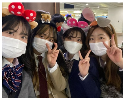
友人たちとロッテワールド(遊園地)へ出かけた時の様子

留学後も、SNSなどを通じて現地の友人との交流を毎日続けています。国境を越え、かけがえのない友人ができたことに大変感謝しています。また、留学を通じて自分が大きく成長できたと感じています。留学前は、まさか自分がサークルを作るという未知の体験をすることになるとは少しも考えていませんでしたが、留学先の環境や周りの人たちの後押しのおかげで、一歩を踏み出すことができたのだと感じています。これからも、留学先で培ったチャレンジ精神を忘れずに、日々を過ごしたいと考えています。