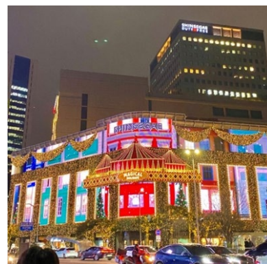
ソウルのクリスマスイルミネーション

私にとって今回の留学は、語学力の向上という目標が達成できただけに留まらず、人生のターニングポイントとなるかけがえのない財産になりました。「語学を学びたい」「海外に興味がある」という人だけでなく、「自分を変えたい」というような思いを持つ人にとっても絶好のチャンスとなると思います。そして、留学前に懸念していた就職活動については、結果として、留学と両立できたと強く感じています。むしろ、留学をしながらも就職活動をしていた積極的な姿勢を、企業から評価していただくことも多かったです。もし就職活動と留学の時期が重なることを心配している方がいれば、迷わずチャレンジしてみてください！